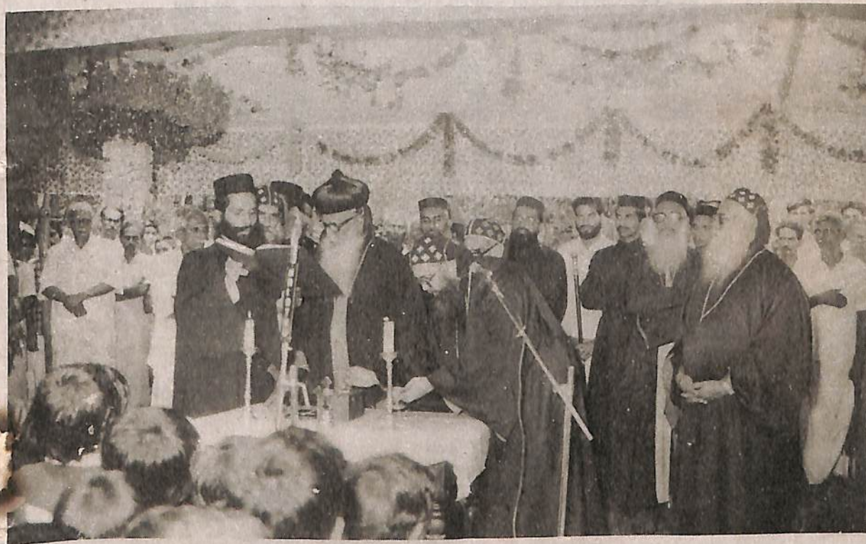
പാമ്പാടി ദയറപള്ളി പുതുക്കിപ്പണികഴിപ്പിക്കുന്നതിന്റെ ശിലാസ്ഥാപനം പ. കാരോലിക്കാബോവാതിരമേനി നിയ്ക്കുന്നു.